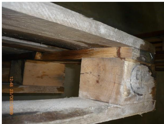
3.1 KÉP: Sérült fedlap-összekötő