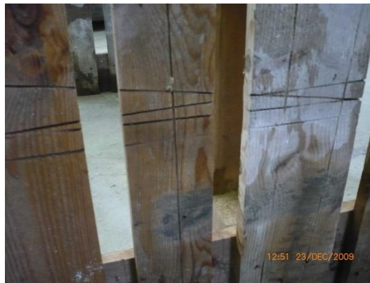
4.3.2 KÉP: Vágás nyomai a raklapon