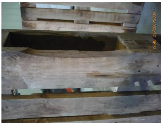
4.1 KÉP: Sérült fedlap