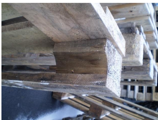
2.1.2 KÉP: Sérült tőkés (százkamentes sérülés)