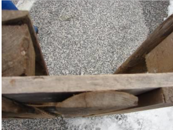
4.3.1 KÉP: Széldeszka