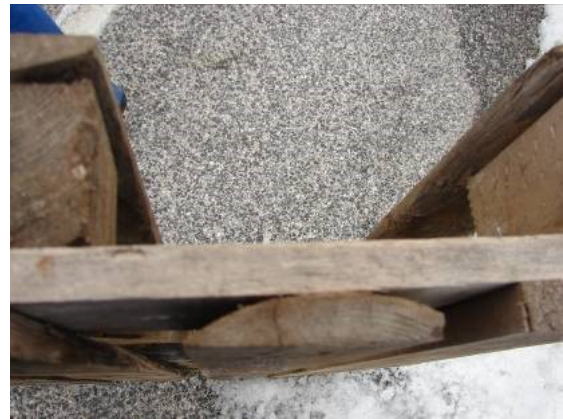
4.3.1 KÉP: Széldeszka