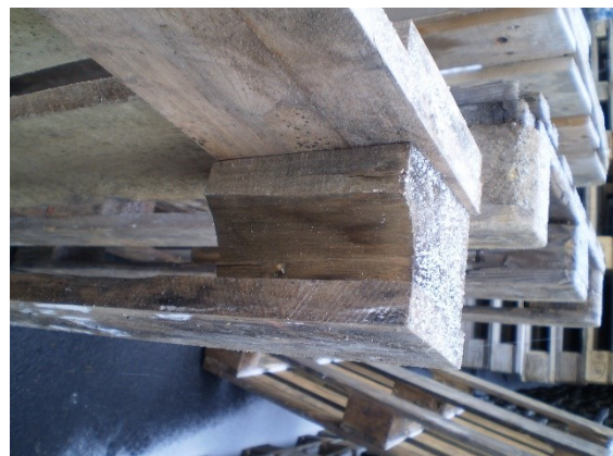
2.1.2 KÉP: Sérült tőkés (szálkamentes sérülés)