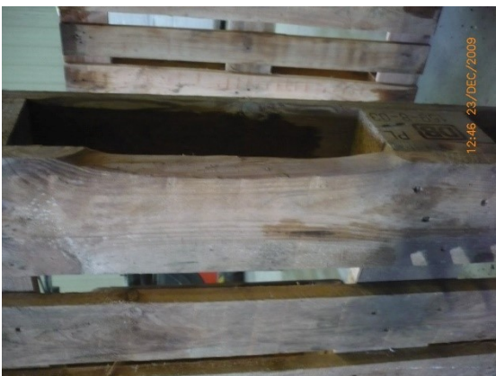
4.1 KÉP: Sérült fedlap