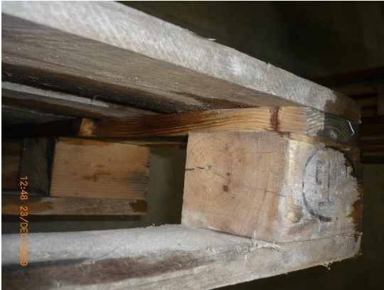
3.1 KÉP: Sérült fedlap-összekötő