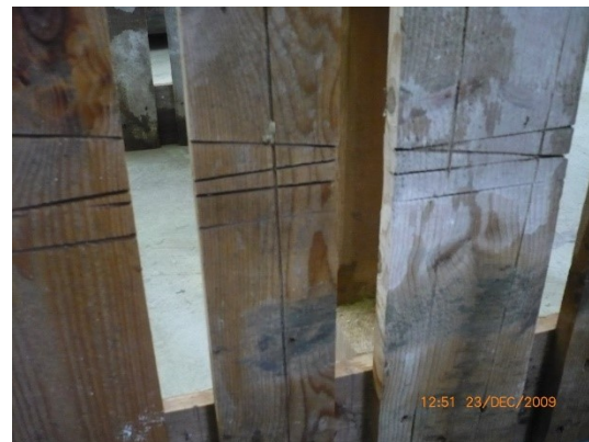
4.3.2 KÉP: Vágás nyomai a raklapon