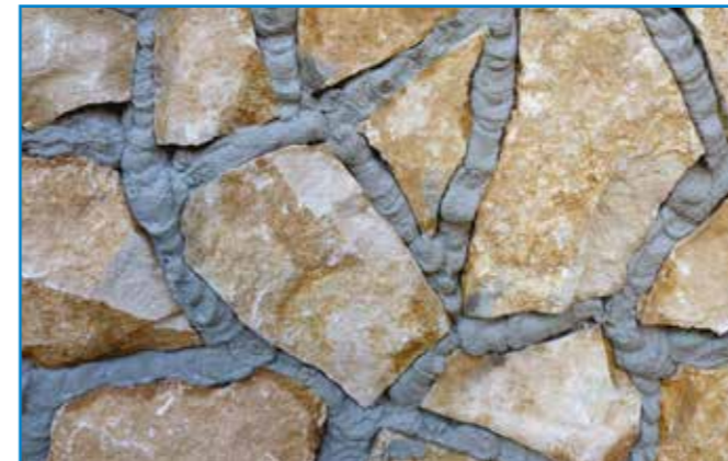
Rövid várakozás után a felesleges anyagot eltávolítjuk.