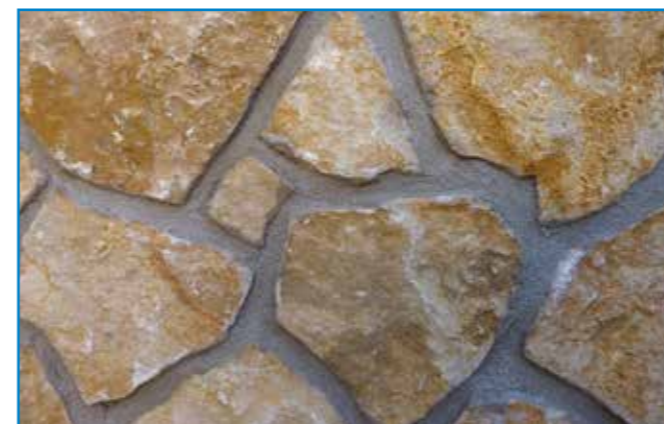
Amikor az anyag kellően meghúzott, ecsettel vagy kefével homogenizáljuk a fugák felületét. A köveket a fugázó teljes megkötése előtt tisztítsuk meg!