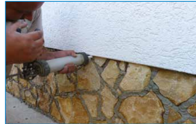
A fugázó anyagot fugázó kanállal vagy kinyomópisztollyal juttatjuk a helyére.

Tisztítás: A burkolatokat lehetőleg a ragasztó száradása előtt, folyamatosan nedves ruhával tisztítsuk.