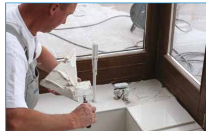
Fokozott hőmozgású helyeken a flexibilis ragasztót az alapfelületre és a burkolat hátoldalára egyaránt hordjuk fel.