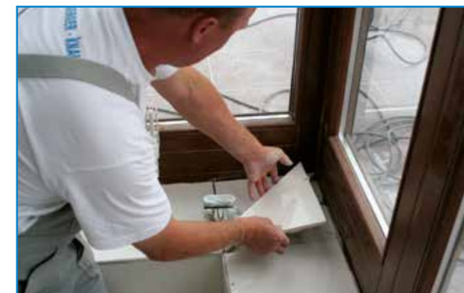
Fehér lapoknál célszerű fehér flexibilis ragasztó (Flex W) használatát.