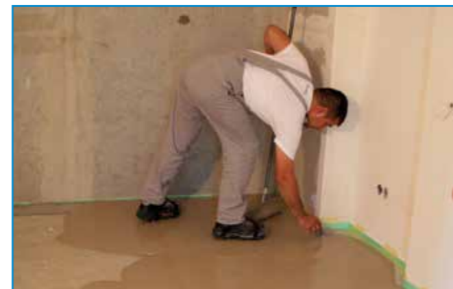
Az anyag terülését a sarkoknál simítóval vagy kőműveskanállal segítjük.

Szerszámok: rozsdamentes acél simító, tuskéhenger, kőműveskanál