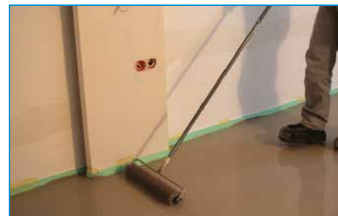
Tuskés hengerrel dolgozzuk át a frissen felhordott önterülő aljzatkiegyenlítőt.