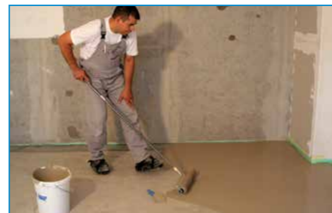
A homogénre kevert aljzatkiegyenlítőt vödörből végzett terítéssel hordjuk fel a megfelelően előkészített aljzatra.