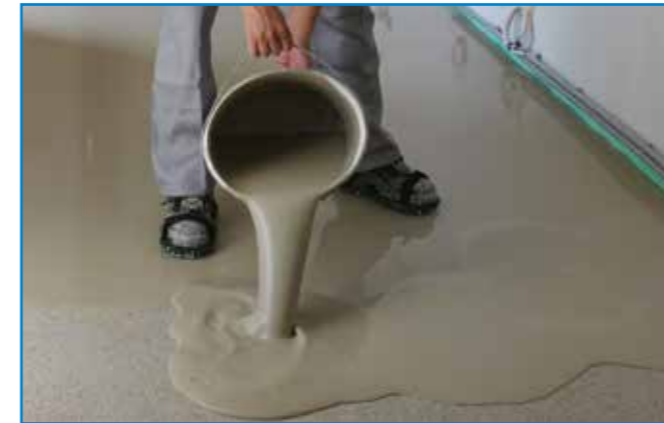
A homogénre kevert aljzatkiegyenlítőt vödörből végzett terítéssel hordjuk fel a megfelelően előkészített aljzatra.

Szerszámok: rozsdamentes acél simító, tuskéhenger, kőműveskanál