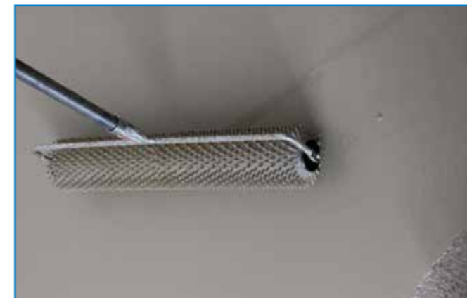
A kilevegőztetést tuskéhengerrel segítjük.