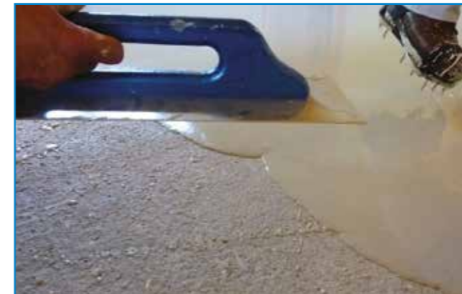
Szükség esetén a felületet kőműveskanállal vagy glettvasal kiigazíthatjuk.