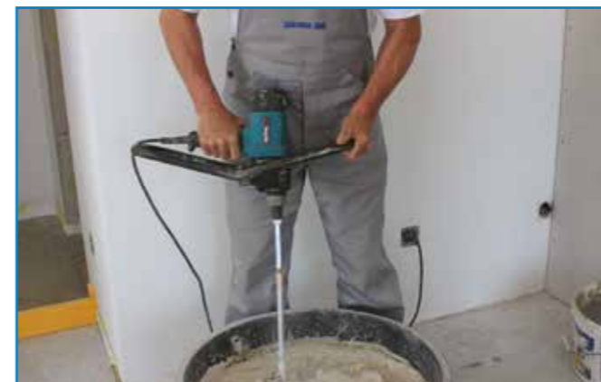
Az aljzatkiegyenlítőt lassú fordulatszámon működtetett keverőgéppel keverjük ki.

Szerszámok: rozsdamentes acél simító, tuskéhenger, kőműveskanál