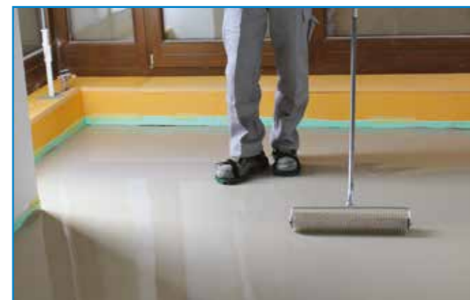
A frissen kiöntött aljzatkiegyenlítőt tuskéhengerrel kilevegőztetjük.