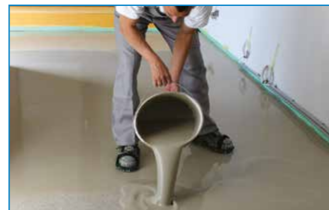
Pihentetés majd újrakeverés után azonnal öntjük ki a felületre.