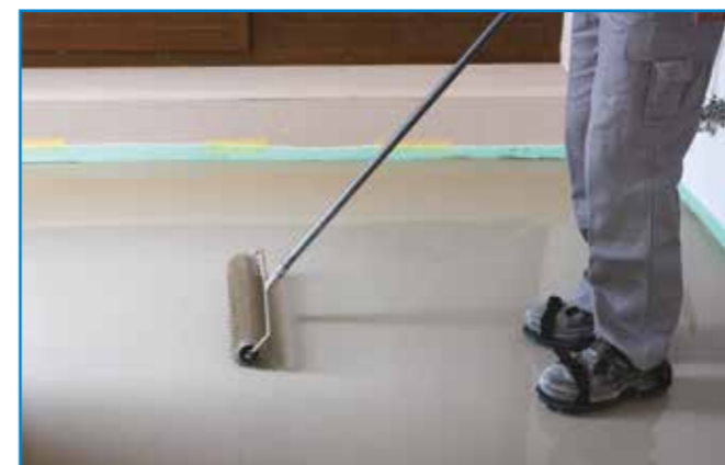
A gyorskötésű anyagoknál is fontos az önterülő aljzatkiegyenlítő kilevegőztetése.