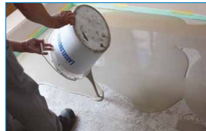
Határidős munkákhoz használjunk gyorskötésű anyagokat!

Szerszámok: rozsdamentes acél simító, tuskéhenger, kőműveskanál