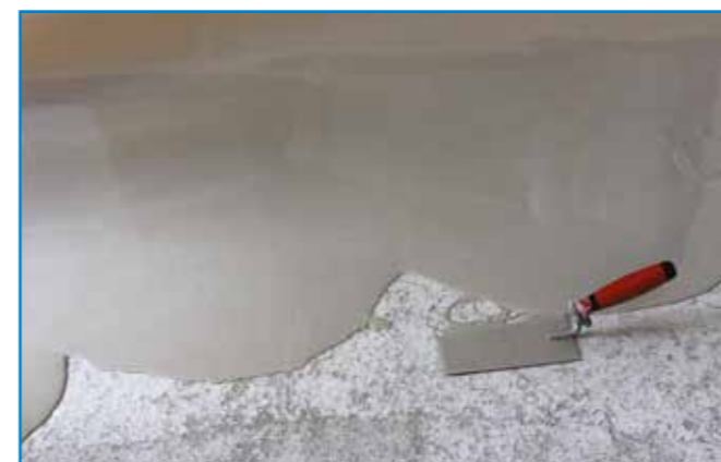
A munka megkezdésétől a felület kiegyenlítésének befejezéséig az anyagot folyamatosan keverjük be és hordjuk fel.