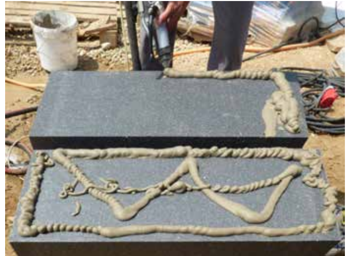
Rendszerragasztó gépi felhordása W-séma szerint

Gépi felhordás esetén a táblák hátoldalára W-séma szerint visszük fel a rendszerragasztót. Ásványgyapot táblák esetén a ragasztási helyeken előzetesen vékony ragasztóréteget kell „bevasalni”, kézzel nagy erővel bepréselni a tábla anyagába. Ragasztó csak az ilyen módon előkezelt helyekre vihető fel!