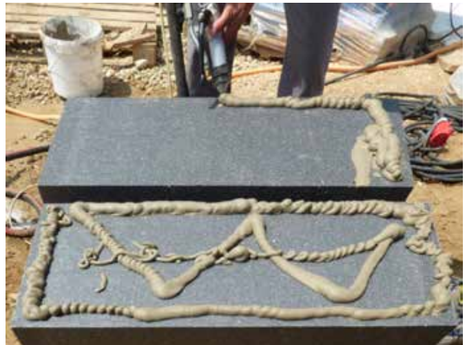
Styrokleber Extra rendszerragasztó gépi felhordása W-séma szerint

Gépi felhordás esetén a táblák hátoldalára W-séma szerint visszük fel a rendszerragasztót.