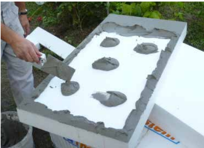
Rendszerragasztó kézi felhordása pont-perem módszerrel

Kézi felhordás esetén a ragasztót a polisztirol hőszigetelő tábla hátsó oldalára "pont-perem" módszerrel hordjuk fel oly módon, hogy a ragasztó fedje körben a tábla hátsó szélét és még 5 pontban borítsa a hátsó oldalát.